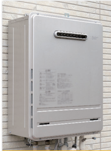
給湯器/エコキュート