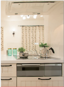
システムキッチン※

次のとおりです。なお、エアコンは、オプションの申込みがある場合に対象機器に含めることができます。